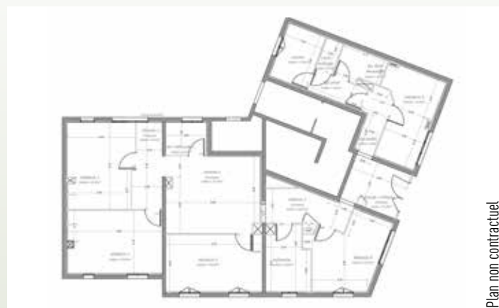
Plan non contractuel

Il est prévu de revoir totalement sa fonctionnalité, en déplaçant la borne d'accueil, en créant un lieu de convivialité et en rendant translucide le garde-corps de l'escalier afin d'avoir une vue plongeante sur le lustre.