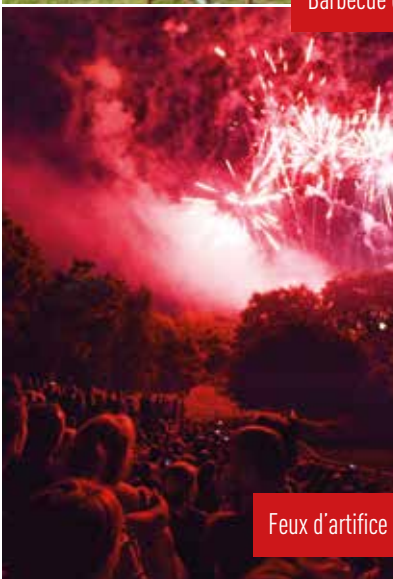
Feux d'artifice et retraite aux flambeaux