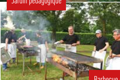
Barbecue et les bénévoles