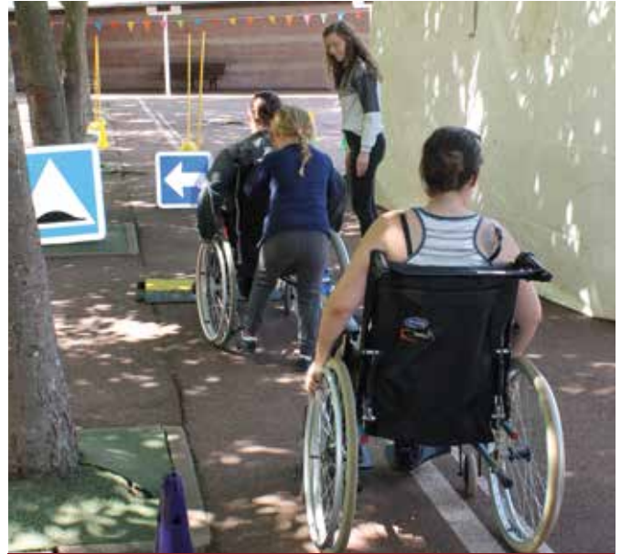
Forum sur le handicap : les enfants avaient imaginé des circuits en fauteuils roulant pour des personnes valides, afin qu'elles découvrent la difficulté qu'il y a à se mouvoir avec un tel "véhicule".

on aurait pu se satisfaire ! Mais les élus ont voulu aller plus loin. Ainsi tous les bâtiments communaux ont été rendus accessibles aux handicapés et balisés par un itinéraire qui les rejoint entre eux.