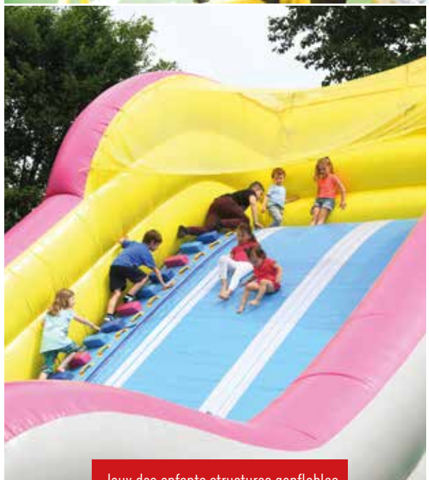
Jeux des enfants structures gonflables